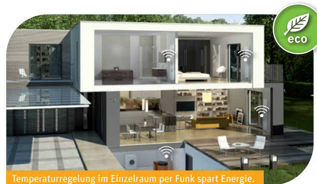
Temperaturregelung im Einzelraum per Funk spart Energie.

Die funkbasierte Einzelraumregelung ermöglicht, für jeden Raum individuell Wohlfühl- und Absenktemperatur zu regeln. Hierzu kommunizieren die Funk-Stellantriebe mit der heatapp! base. Jeder Raum wird so geheizt, wie Sie es wünschen. Und nur dann, wenn Sie es brauchen. Das spart Energie.