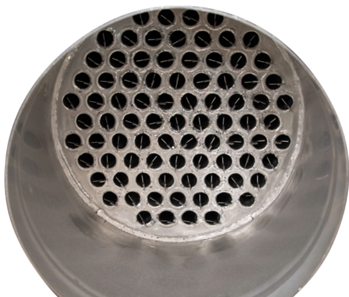
Échangeur de chaleur en inox avec chicane