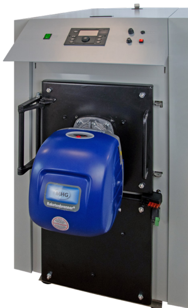
L'EcoTrend Plus avec brûleur flamme bleue à une allure RE1.70