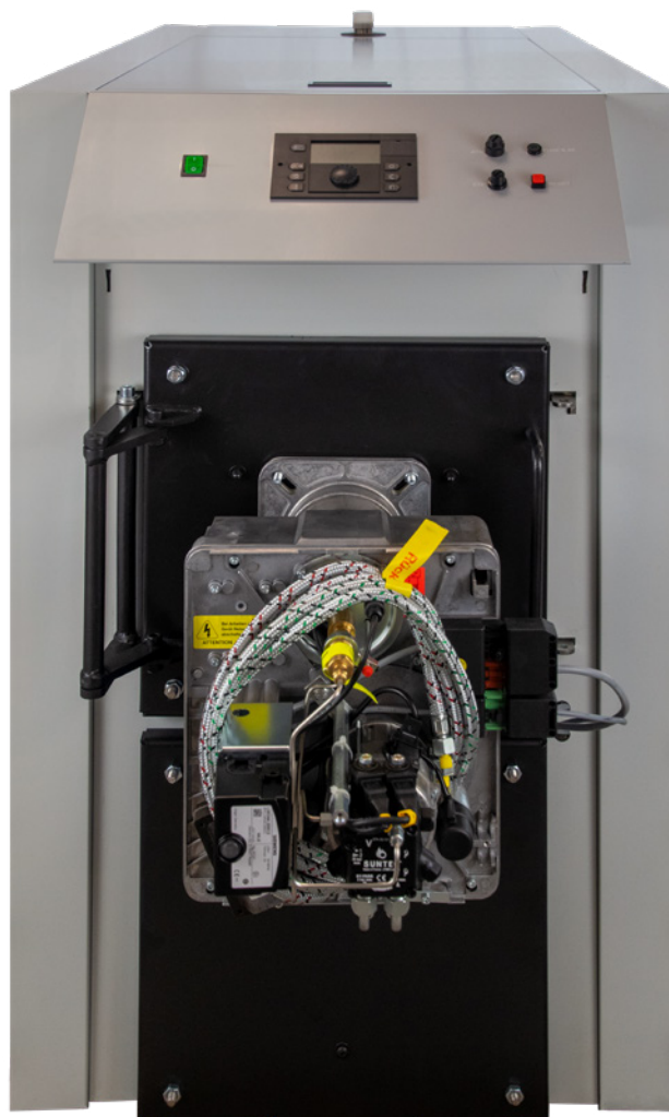
L'EcoTrend Plus avec brûleur flamme bleue à deux allures RZ2.7

Pour nuire le moins possible à l'environnement, les chaudières sont constamment améliorées et optimisées ainsi que les combustibles (mazout eco, mazout bio, ...).